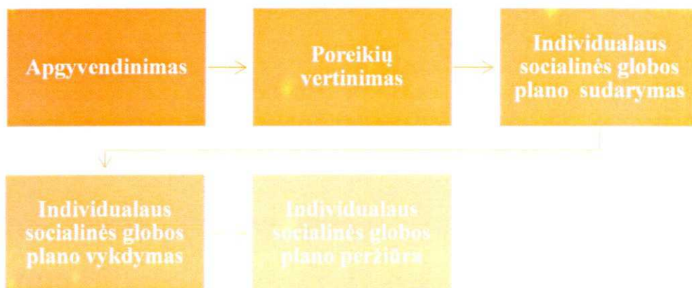
1 pav. Paslaugų teikimo ir organizavimo Lavėnų socialinės globos namuose proceso schema

Individualus socialinės globos planas peržiūrimas ir tikslinamas ne rečiau kaip kartą per metus, o atsiradus naujoms, su asmens sveikatos būkle, naujais poreikiais ar įgūdžiais susijusiomis aplinkybėmis, iš karto po šių aplinkybių atsiradimo.